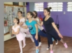
Aula de Balé - CRV