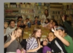
Reunião Clube do Livro